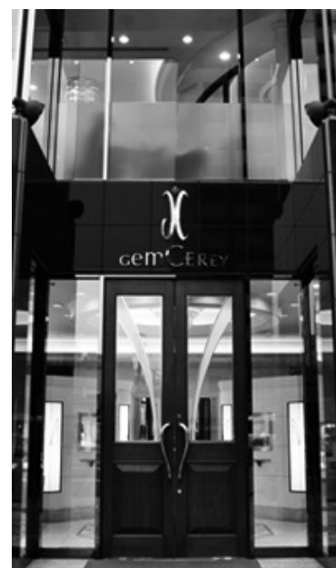
本社ビル1Fにある GemCEREY 京都本店

ます。自負するわけではありませんが、生産からすべての販売チャネルを経験したのは、日本ではジュエリーだけではないでしょうか。広告もテレビCM、ファッション雑誌、チラシ、WEB広告、映画のタイアップ、アーティストとのコラボなど、ありとあらゆる媒体をすべて経験させていただきました。その効果測定も、ジュエリーに取っては大きな財産となっています。成功も失敗も挫折も復活も、すべてが自分の中で新しい何かを生み出すエネルギーに、今轉換されて行っている気がするのです。